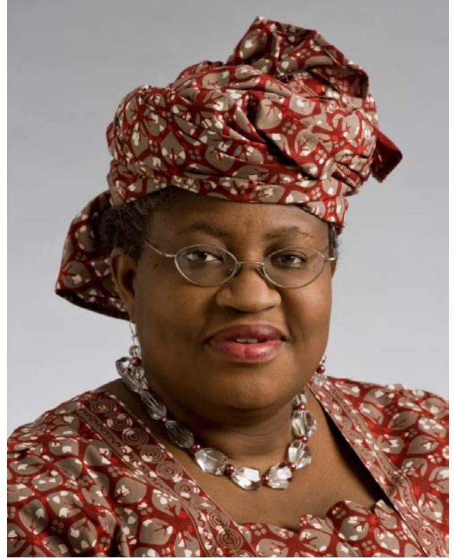
Ngozi Okonjo Iweala Présidente du Conseil des gouverneurs

priorités de renforcement des capacités identifiées par les pays africains. Les partenaires au développement ont réaffirmé leur engagement à apporter l'appui technique et financière à l'ACBF et encouragé la Fondation à aligner son assistance sur les priorités régionales et nationales.